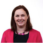
Eluned Parrott AC