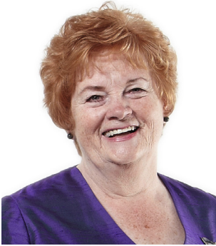
Y Fonesig Rosemary Butler AC

Ceir llai o fenywod na dynion mewn bywyd cyhoeddus. Er mai menywod yw dros hanner y boblogaeth, nid yw eu lleisiau'n cael eu clywed, ac mae eu safbwyntiau'n cael eu hanwybyddu. Mae Llywydd Cynulliad Cenedlaethol Cymru, y Fonesig Rosemary Butler AC yn gweithio i fynd i'r afael â'r angen i fwy o fenywod ymgeisio ac ymgymryd â swyddi a phenodiadau cyhoeddus. Nod yr ymgyrch Menywod mewn Bywyd Cyhoeddus yw sicrhau y caiff menywod eu cynrychioli'n deg ar bob lefel o fywyd cyhoeddus yng Nghymru.